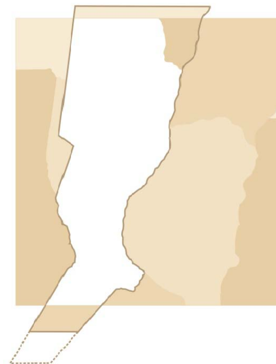
Límites originales de la Provincia de Santa Fe

En el acta de fundación de la ciudad Juan de Garay expresa con respecto a la jurisdicción de Santa Fe "Otro sí, nombro y señalo por jurisdicción de esta ciudad: por la parte del camino del Paraguay y hasta el cabo de los anegadizos y ríos chicos y por el río bajo, camino de Buenos Aires, veinticinco leguas más abajo de Sancti Spiritus, y hacia las partes del Tucumán, cincuenta leguas a la tierra dentro desde las barrancas de este río y de la otra parte del Paraná, otras cincuentas". De esto resulta que la extensión superficial que tuvo originariamente nuestra provincia era muy grande: por el este abarcaba más de la mitad de la actual provincia de Corrientes, la totalidad de Entre Ríos, una pequeña zona del Brasil cercana a la uruguaya y parte del territorio de la República Oriental del Uruguay; por el oeste, el meridiano demarcatorio pasaba por las actuales provincias